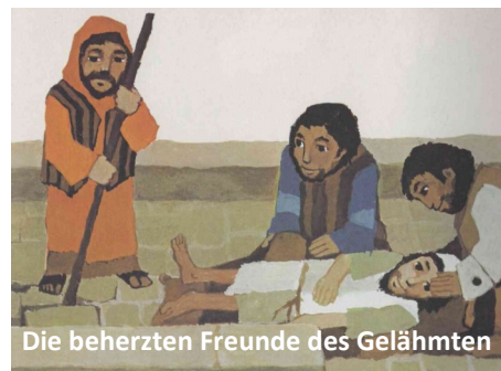
Die beherzten Freunde des Gelähmten

Samstag, 9. März, 10.00, Reformierte Kirche Reinach